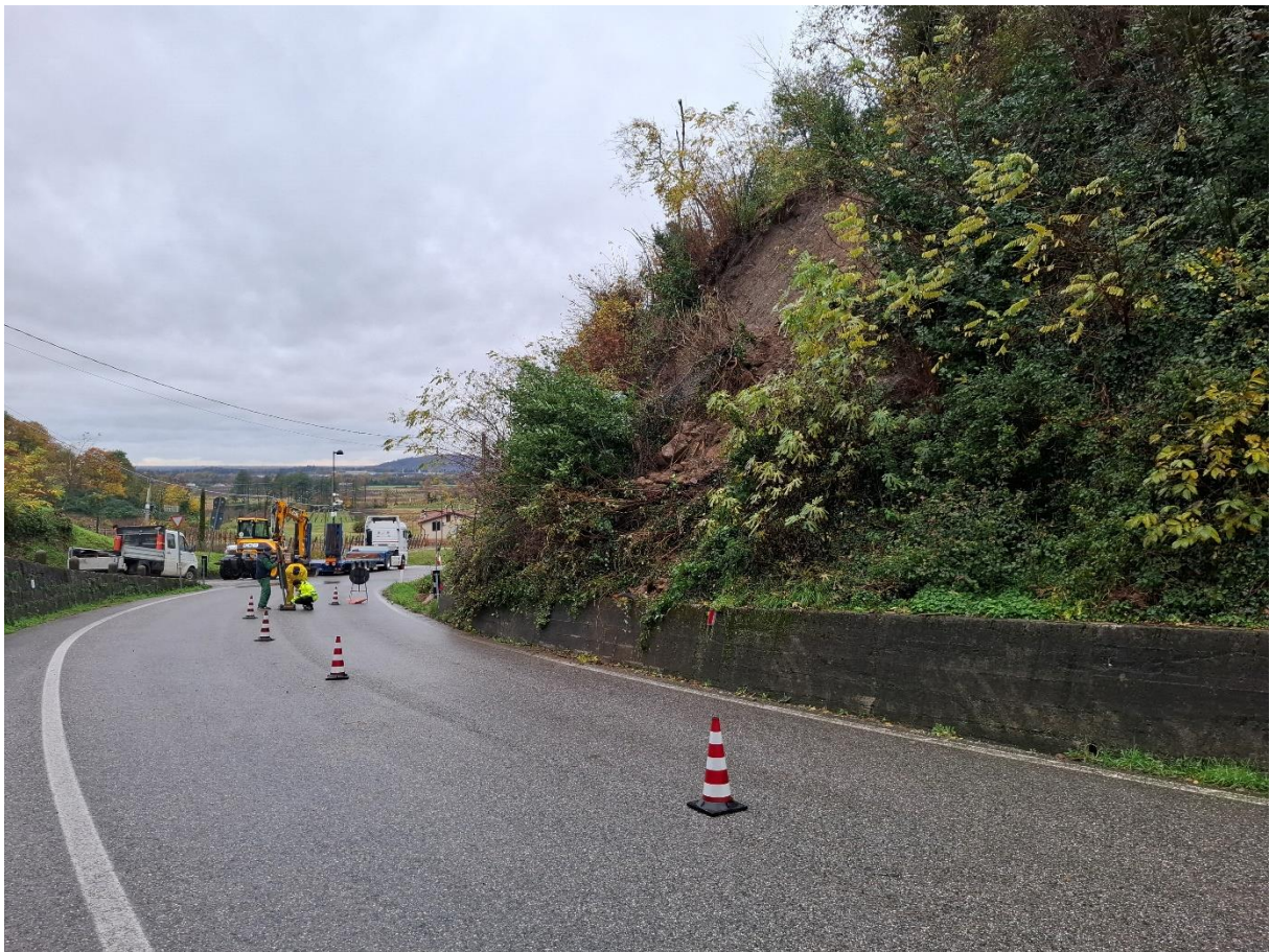
Figura 5: Operazioni di confinamento della corsia nella giornata del 17/11/2025 dopo la rimozione del materiale sul piano viabile