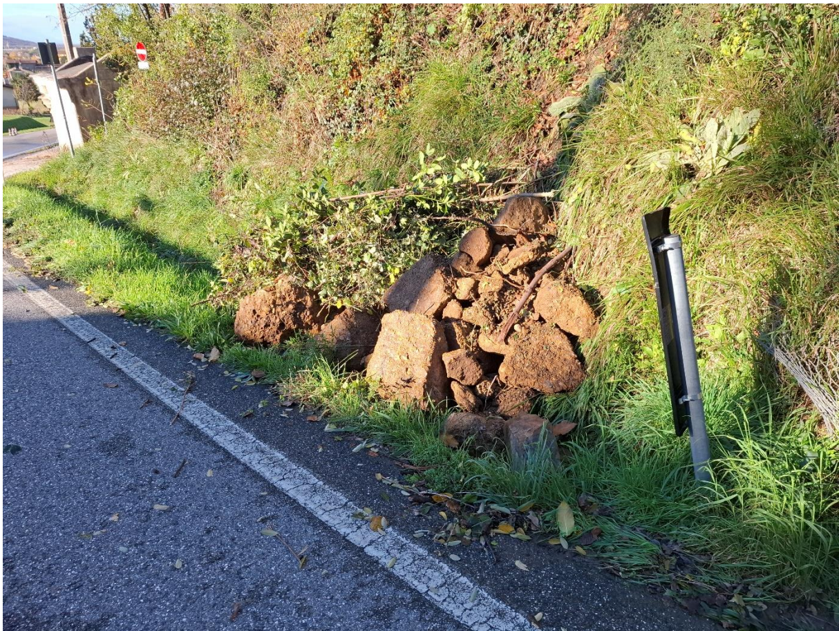
Figura 3: Materiale rinvenuto sul piano viabile e depositato in via provvisoria nel margine stradale della strada regionale.