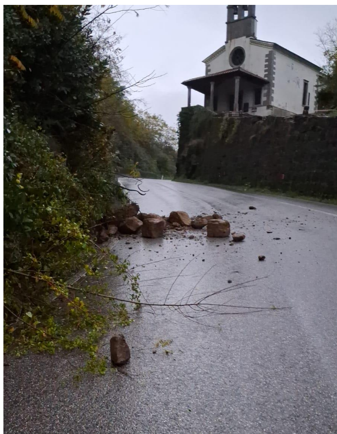
Foto 2: evidenza del materiale lapideo e terroso franato sul piano viabile della SR 409 (17/11/2025)