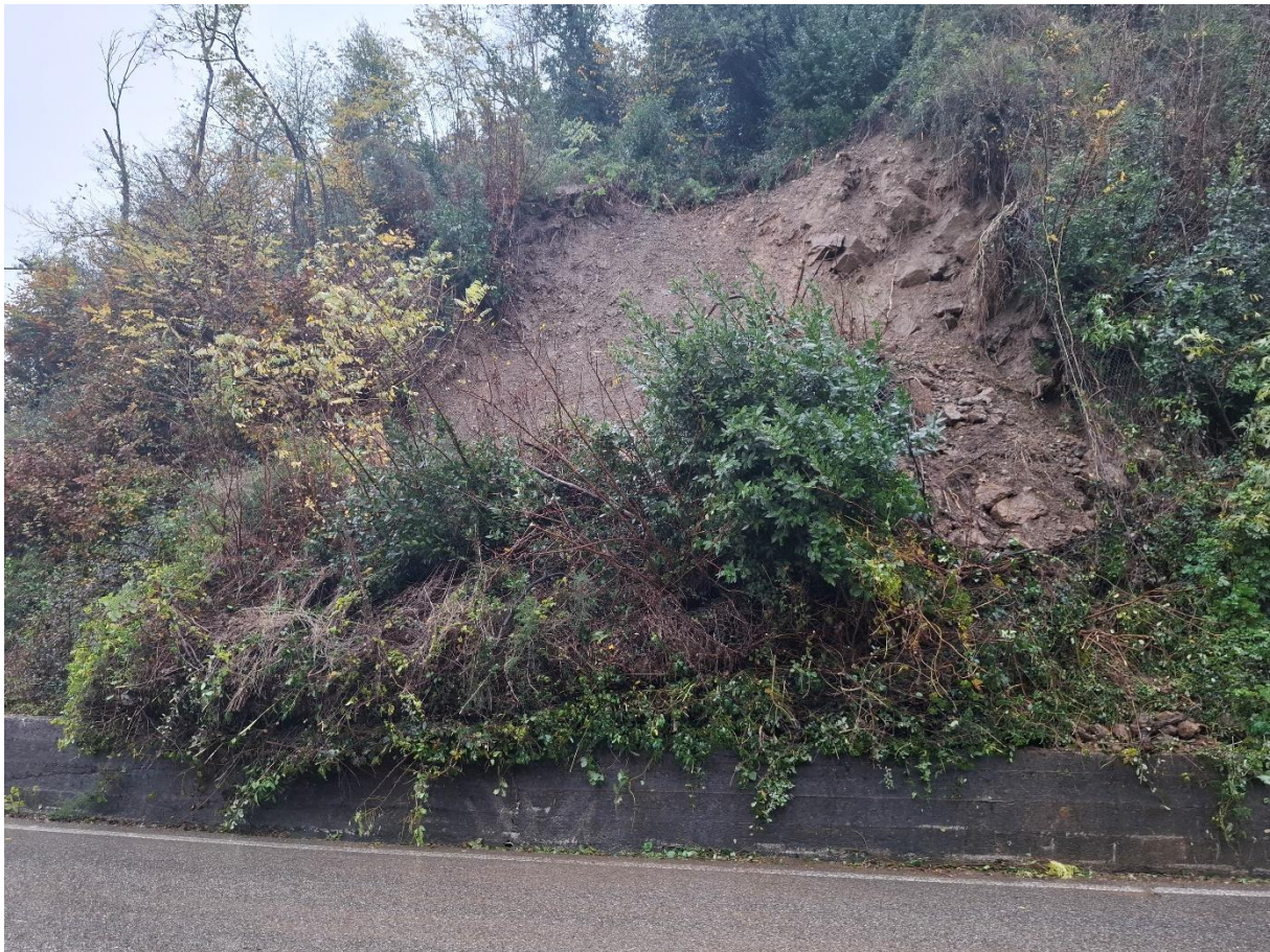
Figura 4: Visione frontale dello smottamento al km 1+900 ca.