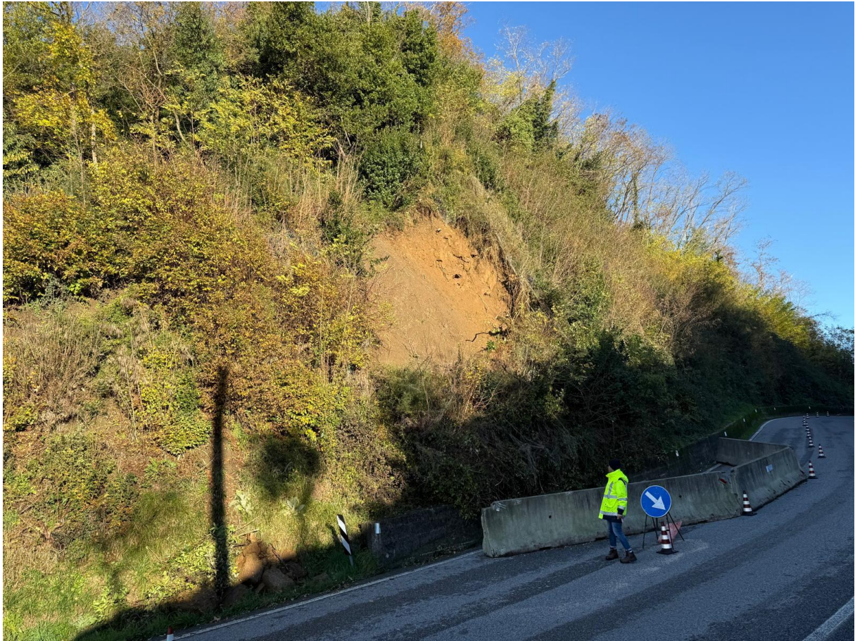
Figura 7: Stato dei luoghi al 19/11/2025