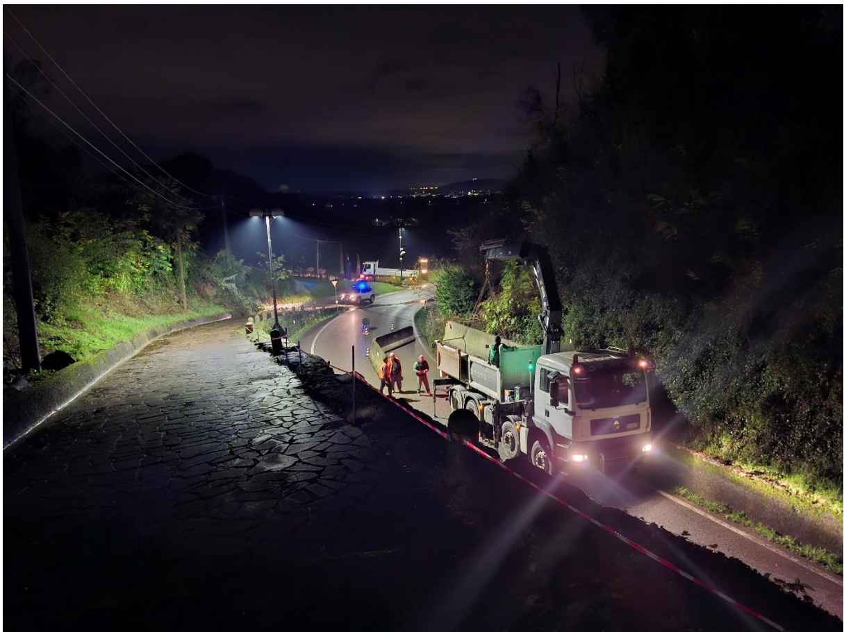
Figura 6: Confinamento definitivo della zona critica nella serata tra il 17/11/2025 ed il 18/11/2025